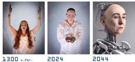
1300 v. Chr. 2024 2044